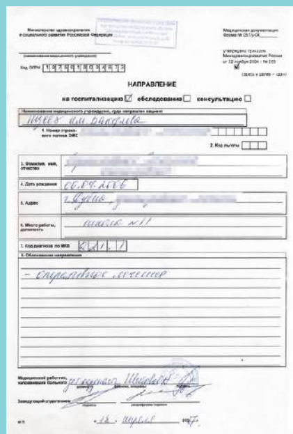
Направление на операцию